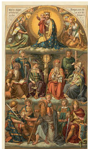
Die heiligen 14 Nothelfer: 1. St. Barbara, 2. St. Katharina, 3. St. Margaretha, 4. St. Agathe, 5. St. Dorothea, 6. St. Elizabeth, 7. St. Ursula, 8. St. Kolumba, 9. St. Erasmus, 10. St. Gallus, 11. St. Vitus, 12. St. Christoforus, 13. St. Eustachius, 14. St. Wendelin.

Am 20.9. gedenken wir schließlich des heiligen Eustachius , dessen Name der Standfeste bedeutet. Er soll ein heidnischer Feldherr des Kaisers Trajan gewesen sein. Als ihm bei einer Jagd ein Hirsch erschien, der zwischen seinem Geweih den Gekreuzigten in Strahlenglanz trug, ließ er sich mit der ganzen Familie taufen. Durch Kriegswirren wurde die Familie getrennt, fand sich nach langen Jahren durch Zufall wieder, erlitt aber bald darauf gemeinsam den Märtyrertod. Eustachius, der Patron von Paris und Madrid, ist der Helfer bei traurigen Familienschicksalen. Er gebe uns Geduld und das nötige Gottvertrauen in schwierigen Situationen.